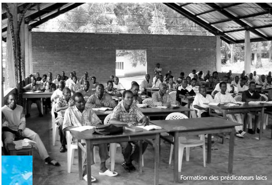
Formation des prédicateurs laïcs

Tout disciple du Christ a d'abord été appelé par lui. C'est l'appel général au salut, à la fois