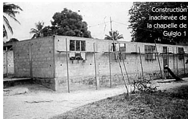
Construction inachevée de la chapelle de Guiglo 1

Aujourd'hui, les serviteurs de Dieu sont face à de grandes difficultés d'accès à certains lieux de culte : d'abord en raison du mauvais état de nos routes, mais aussi parce que les liaisons entre les différentes villes et villages sont