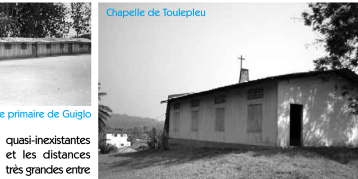
Chapelle de Toulépleu