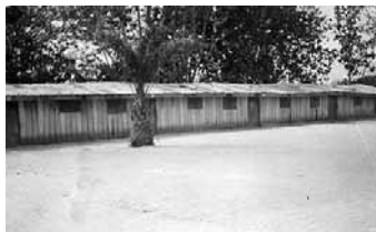
Ecole primaire de Guiglo

A Duékoué, l'école est malheureusement infestée par la décharge utilisée par des voisins malintentionnés à l'entrée de la station : le besoin d'une clôture est urgent.