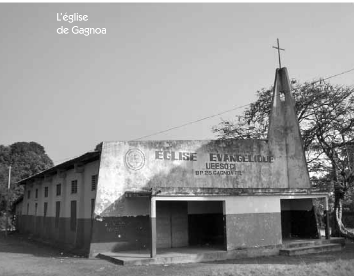
L'église de Gagnoa