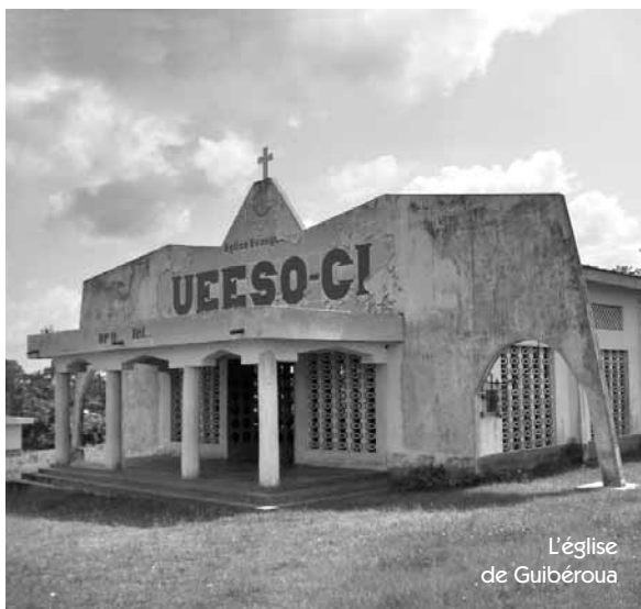
L'église de Guibéroua