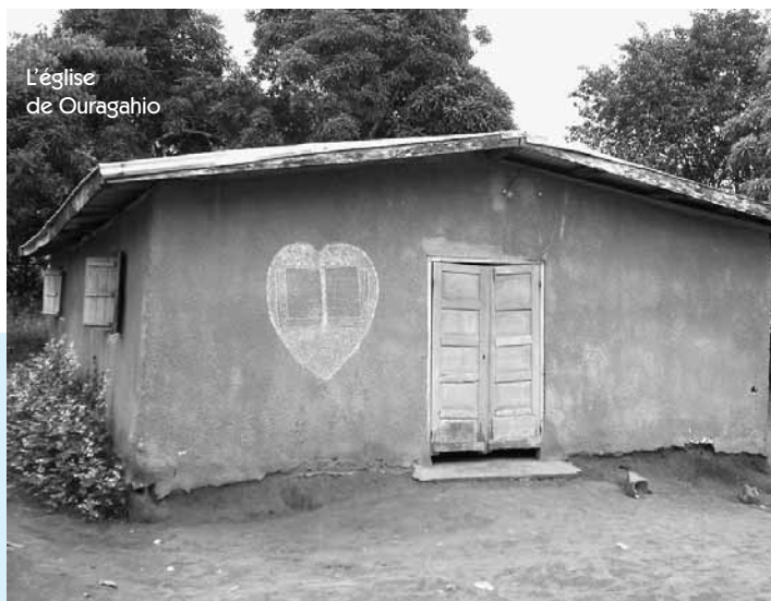
L'église de Ouragahio

Nous sommes actuellement 4 pasteurs titulaires qui travaillons dans cette région éprouvée :