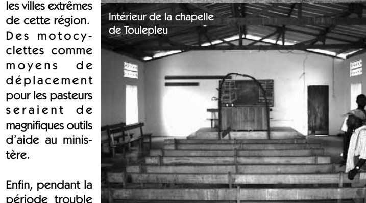
Intérieur de la chapelle de Toulépleu

quasi-inexistantes et les distances très grandes entre les villes extrêmes de cette région. Des motocyclettes comme moyens de déplacement pour les pasteurs seraient de magnifiques outils d'aide au ministère. Enfin, pendant la période trouble de la guerre, les cotisations à la CNPS (Caisse d'Assurance Maladie et de Retraite) n'ont pu être versées, ce qui fait que les pasteurs ne