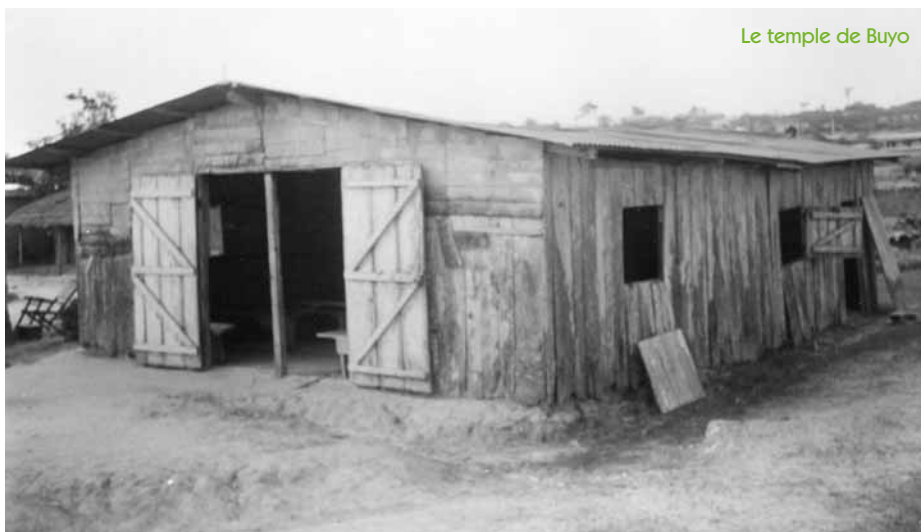
Le temple de Buyo

Un effort d'évangélisation a eu lieu pendant tout le mois de mars : 20 villages ont été visi-