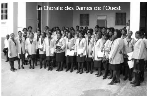
La Chorale des Dames de l'Ouest

D ans son discours, la présidente de la FAF a rappelé aux femmes l'importance d'avoir une bonne estime de soi : « Femmes ! Vous êtes d'un grand prix aux yeux de Dieu et d'une valeur inestimable aux yeux des hommes », et en conclusion, elle a exhorté l'assistance à vivre selon le thème retenu : « Ainsi, nous les femmes respectées et respectables, honorées et honorables de l'Union Évangélique Baptiste d'Haïti, sommes très reconnaissantes à Dieu de nous avoir créées avec tant de potentialité. Nous sommes aussi conscientes de notre tâche de maintenir nos foyers dans l'ordre et la discipline, par la prière, le respect, l'honneur et l'amour; conscientes aussi de notre devoir de soutenir les bras de nos pasteurs dans l'œuvre que Dieu leur a confiée et, enfin, de gagner notre société pour Christ par l'évangélisation et par la prière. »