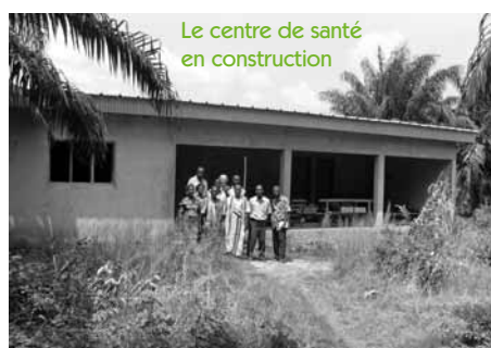
Le centre de santé en construction