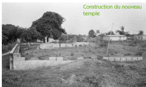
Construction du nouveau temple

tés, près de 1 000 personnes ont été touchées, 500 personnes ont décidé de suivre Jésus-Christ comme Seigneur et Sauveur ; 3 nouveaux lieux de culte sont créés : Boguedia , Edmond-carrefour et Bemady ; 10 lieux de culte ont vu le nombre de leurs auditeurs s'accroître : par exemple, à Digbam ils sont passés de 30 auditeurs à 80.