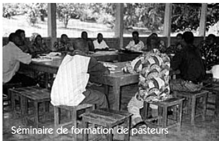
Séminaire de formation de pasteurs

• La région a à cœur la formation des prédicateurs et le recyclage des pasteurs, notamment par la formation Excelsis et l'organisation d'une convention annuelle. Cette formation a apporté des changements et certains participants en témoignent : « J'ai été baptisé en 1957. Je suis prédicateur depuis plusieurs années. Mais par la formation Excelsis , j'ai découvert une nouvelle méthode de présentation de l'enseignement biblique et d'or-