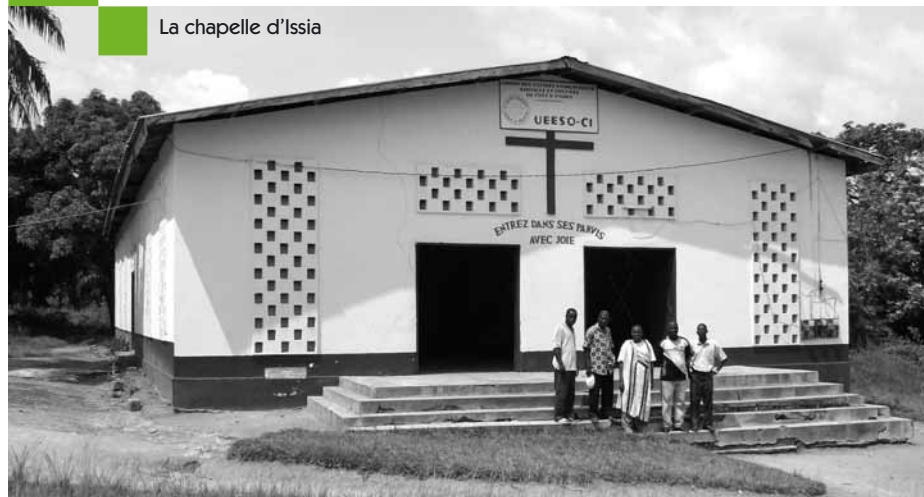
La chapelle d'Issia