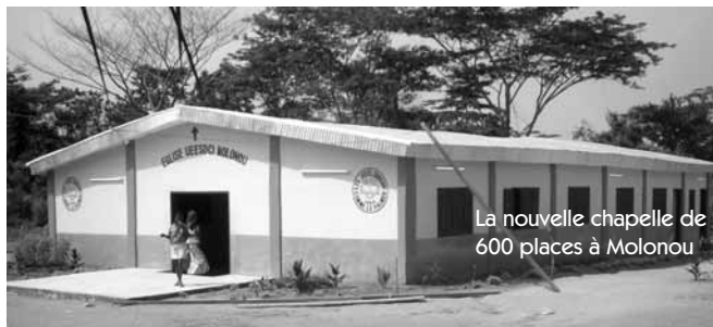
La nouvelle chapelle de 600 places à Molonou