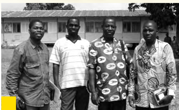
↑ Pasteurs de la région de Danané