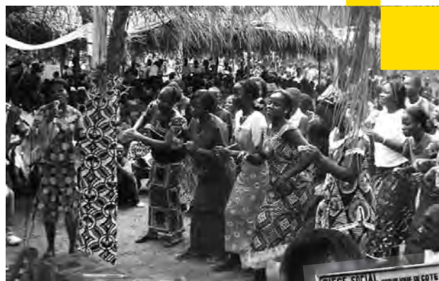
Chants et danse lors d'une convention

Bien que l'Église ait obtenu des avancées considérables dans la région de Danané, les coutumes et croyances ancestrales existent encore bel et bien, certaines ayant des conséquences dangereuses pour la santé : risque de contamination par le virus du SIDA pour les jeunes filles excisées par exemple. Face à cette pratique, l'enseignement biblique dispensé par les pasteurs et les responsables de l' ONG