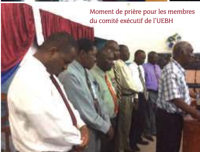
Moment de prière pour les membres du comité exécutif de l'UEBH

rencontre planifiée à 15h pour les pasteurs et les assistants pasteurs de la Conférence des Pasteurs de l'UEBH (COPAS/UEBH) a réuni une soixantaine de participants.