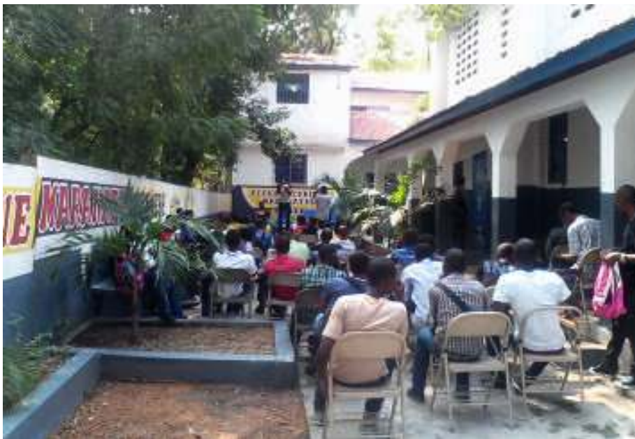
Cours à l'École Technique Maranatha

mensuels, mais il me reste à payer les frais de rentrée. Seul Dieu sait comment on va obtenir ce diplôme !