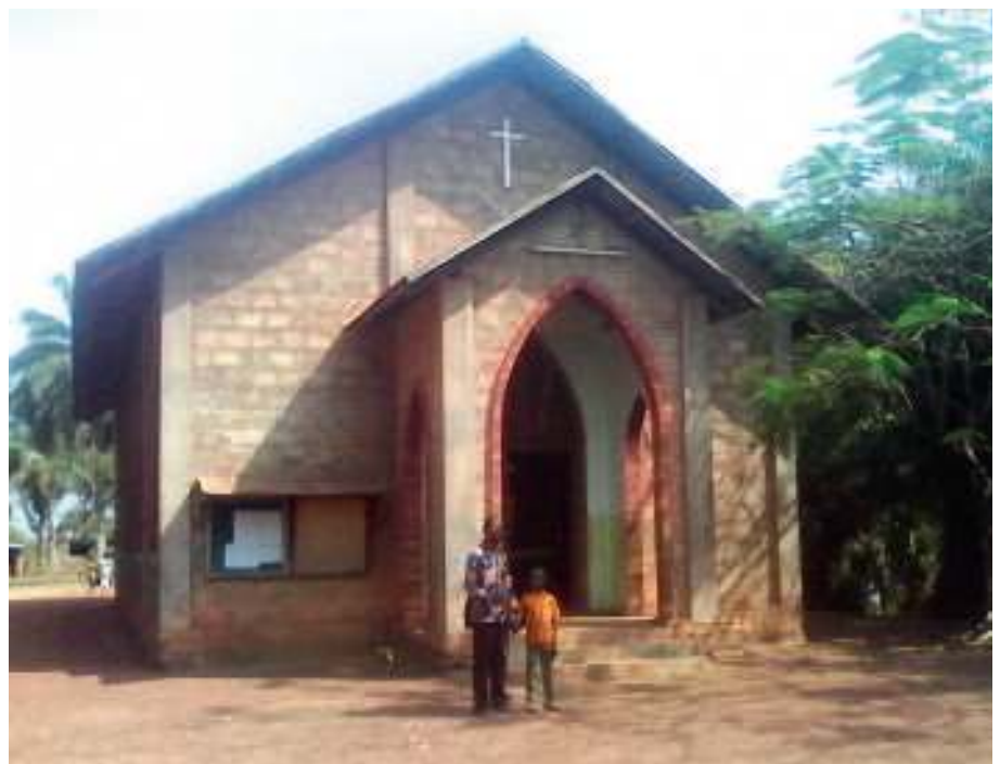
Devant la chapelle de Danané

RD Notre objectif est de former des regroupements d'aveugles par localités et de trouver des bail-