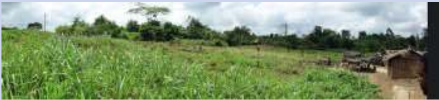
Le terrain à Toutoubré