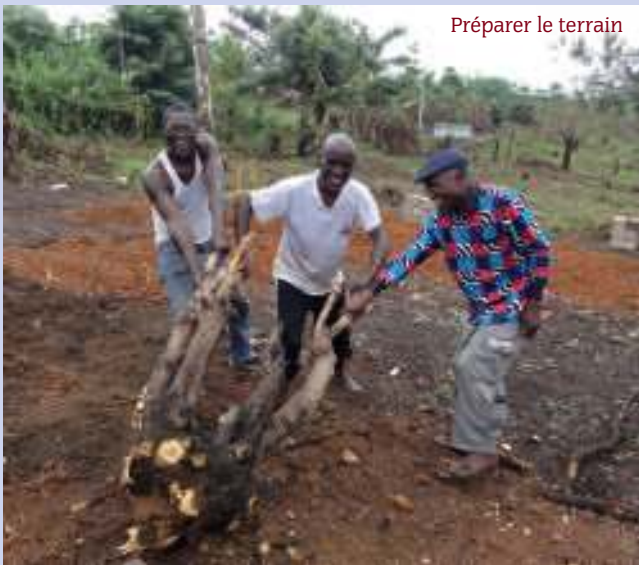
Préparer le terrain