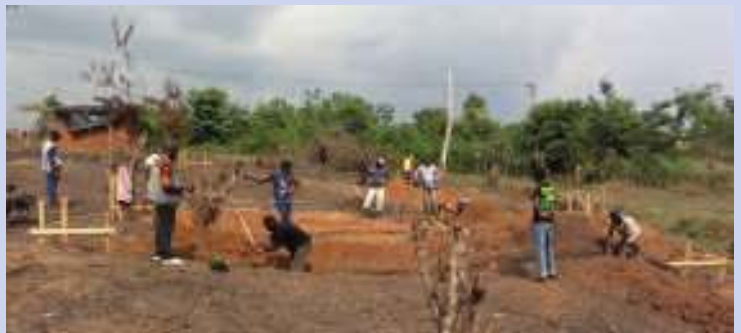
Les volontaires au travail