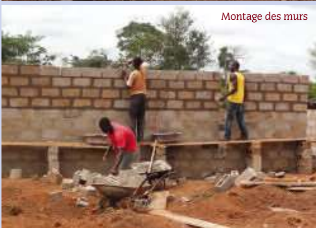
Montage des murs